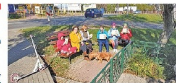
Quest - odkrywanie Ragul