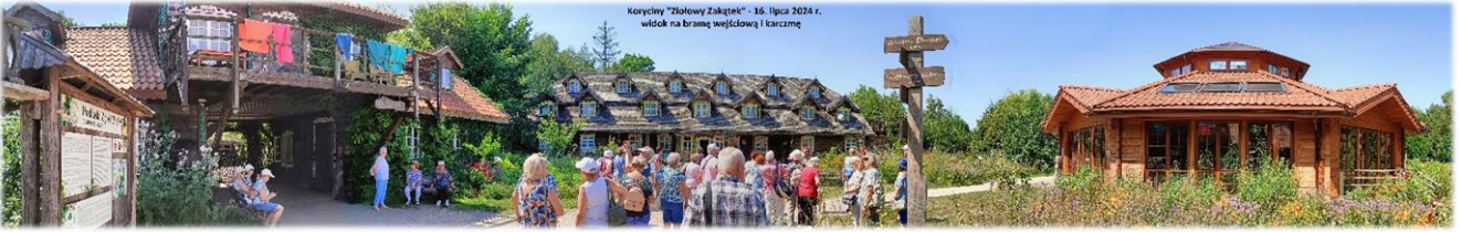
Koryciny "Ziołowy Zakątek" - 16. lipca 2024 r. widok na bramę wejściową i karczmę