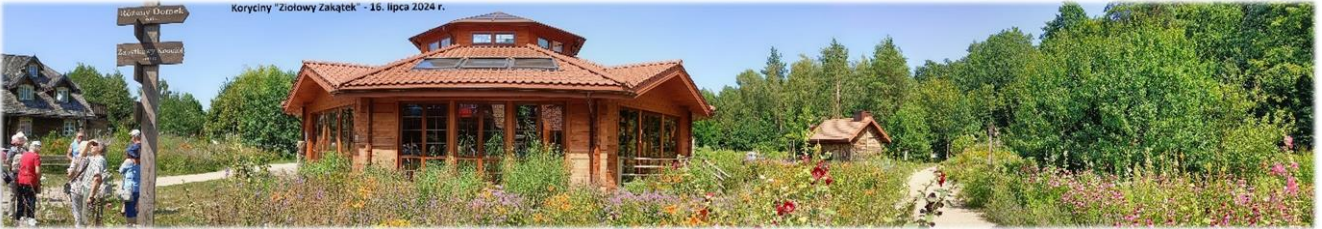
Koryciny "Ziołowy Zakątek" - 16. lipca 2024 r.