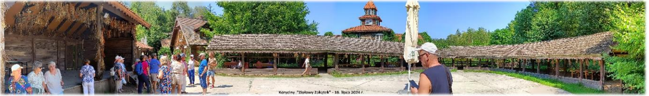
Koryciny "Ziołowy Zakątek" - 16. lipca 2024 r.