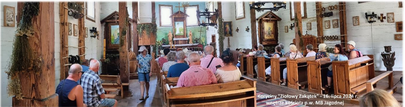
Koryciny "Ziołowy Zakątek" - 16. lipca 2024 r. wnętrze kościoła p.w. MB Jagodnej